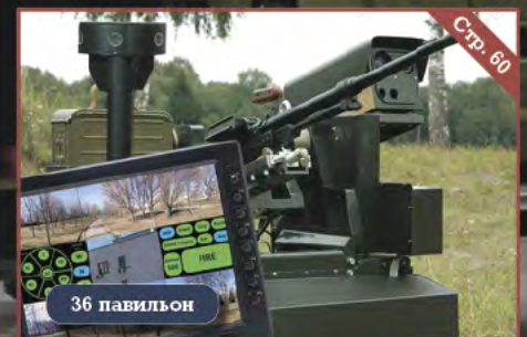
ОАО «КБ «ДИСПЛЕЙ»