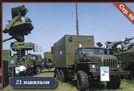
МФПГ «Оборонительные системы»